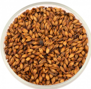
Солод карамель- ный