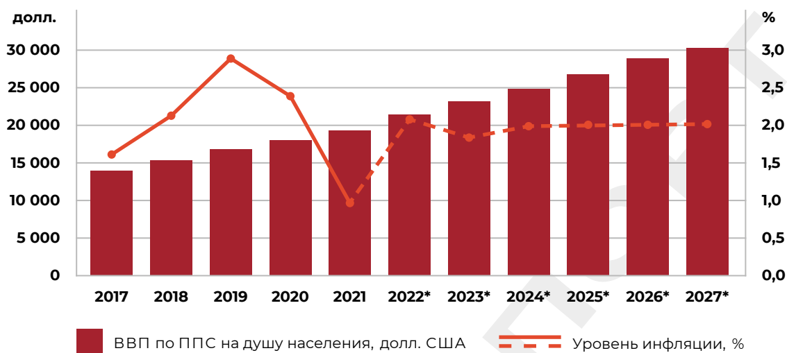
Рис. 3. Динамика инфляции и ВВП по ППС на душу населения, 2017-2027 гг.