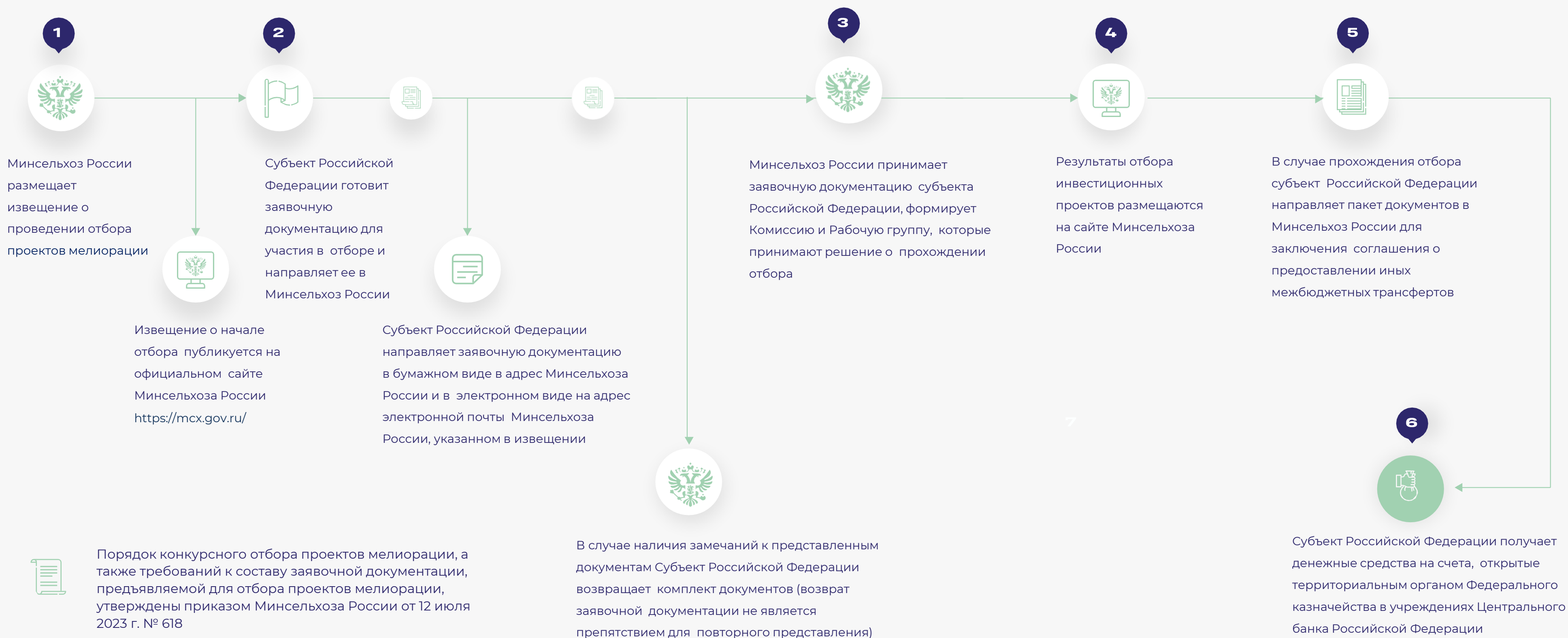
СХЕМА ПРОХОЖДЕНИЯ СУБЪЕКТОМ РОССИЙСКОЙ ФЕДЕРАЦИИ КОНКУРСНОГО ОТБОРА ПРОЕКТОВ МЕЛИОРАЦИИ