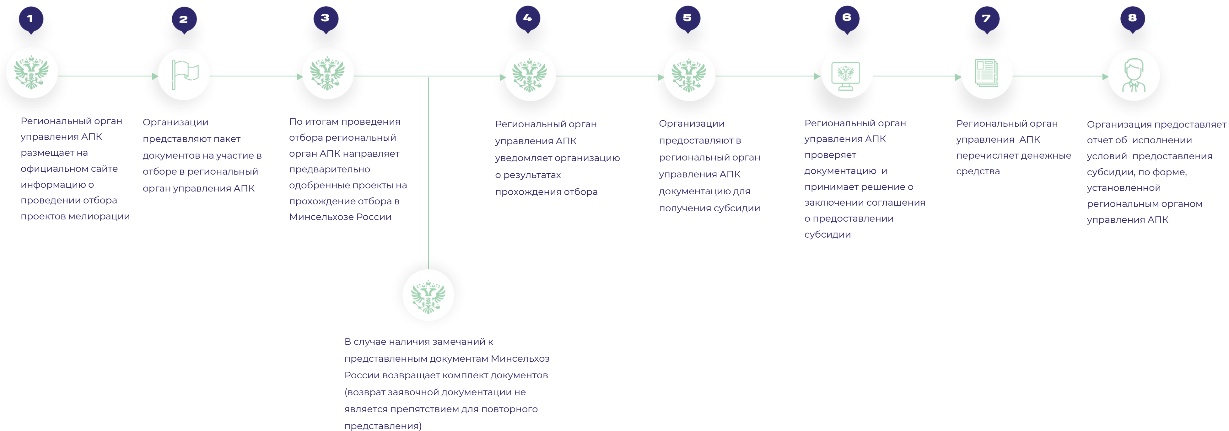
СХЕМА ПОЛУЧЕНИЯ ОРГАНИЗАЦИЕЙ ПОДДЕРЖКИ (НА ПРИМЕРЕ ОДНОГО ИЗ РЕГИОНОВ)